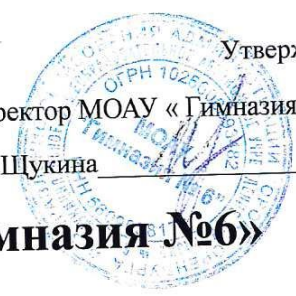
График питания обучающихся МОАУ «Гимназия №6»